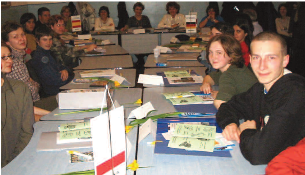
Nasi przedstawiciele podczas zajęć warsztatowych w rumuńskiej Devie