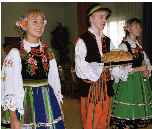
Powitanie chlebem i solą zagranicznych gości

Opiekunowie uczniów brali udział w warsztatach informatycznych, podczas których wypracowano materiały do biuletynu podsumowującego trzyletnią współpracę. W programie pobytu zagranicznych gości najważniejszym punktem było uroczyste spotkanie z władzami miasta, podczas którego nastąpiła prezentacja wszystkich szkół partnerskich w formie artystycznych programów. Tańce w oryginalnych strojach ludowych wykonane przez uczniów Gimnazjum nr 1 wzbudziły aplauz międzynarodowej publiczności. Kolejne dni wizyty zagranicznych gości w Polsce zostały przeznaczone