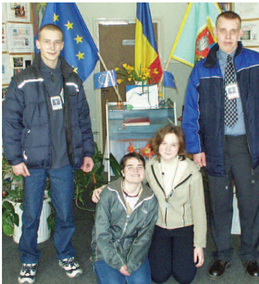
Uczniowie naszego Gimnazjum w rumuńskiej szkole

Realizacja projektu w ramach programu „Socrates-Comenius” wiązała się z wizytami uczniów i nauczycieli w szkołach partnerskich. W marcu 2003 gimnazjaliści z Koluśzek pod opieką nauczycieli gościli w Devie - najstarszej stolicy Rumunii, położonej w górach, w północno-zachodniej części kraju. Koluśkowianie spotkali się nie tylko z gospodarzami, ale również z młodzieżą i nauczycielami z Irlandii, Włoch, Hiszpanii i Niemiec. Podczas międzynarodowych warsztatów przedstawili film wideo poświęcony Gimnazjum, najlepsze prace plastyczne z konkursu „Moja szkoła”, szkolną kronikę, a także samodzielnie