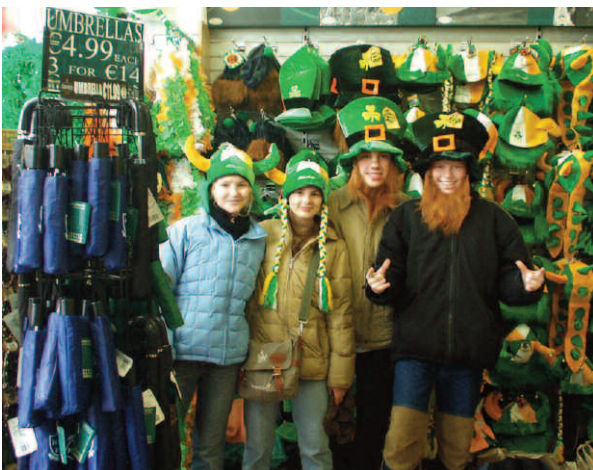
Nasi uczniowie podczas wędrowki po Dublinie przygotowują się do obchodów Dnia św. Patryka