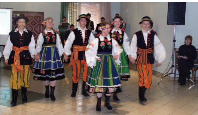
Oberek w wykonaniu koluszkowskich gimnazjalistów

wie ze szkół partnerskich: Hiszpanie z Cardedeu, Włosi z Taranto, Rumuni z Devy, Irlandczycy z Dublina, Niemcy z Böblingen. Jeszcze nigdy Koluszki nie przyjęły tak dużej, liczącej 40 osób, zagranicznej delegacji. Uczniowie zza granicy mieszkali w domach swoich polskich kolegów, co bardzo sobie cenili. To sprawiło, że kontakty młodzieży z krajów partnerskich przerodziły się w międzynarodowe przyjaźnie. Dla gości przygotowano szereg atrakcji. Pierwszy dzień wizyty był poświęcony poznawaniu szkoły oraz specyfiki zajęć edukacyjnych. Młodzież została podzielona na grupy, które brały udział w zajęciach: plastycznych, muzycznych, ekologicznych. Efekty pracy uczestników projektu mogli podziwiać nie tylko uczniowie całej szkoły, nauczyciele, ale także rodzice. Zorganizowano, m.in. wystawę prac malarskich, a międzynarodowa grupa uczestnicząca w warsztatach muzycznych zaprezentowała kanon „Panie Janie” w językach partnerów projektu „A School, a Land”: angielskim, niemieckim, hiszpańskim, rumuńskim, włoskim i polskim.